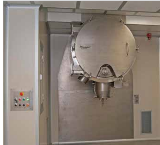
Монтаж системы PLANEX в чистом помещении

Кроме того, сведенный до минимума зазор между профилем лопаток и стенкой сушильной камеры позволяет избежать оседания продукта и делает разгрузку крайне простой и эффективной, а при помощи специальной программы этот процесс происходит автоматически. В соответствии с полученными результатами после разгрузки в системе PLANEX® наблюдается наличие минимального остаточного продукта – в среднем менее 1 %.