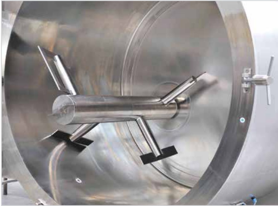
Профиль концентрических лопаток