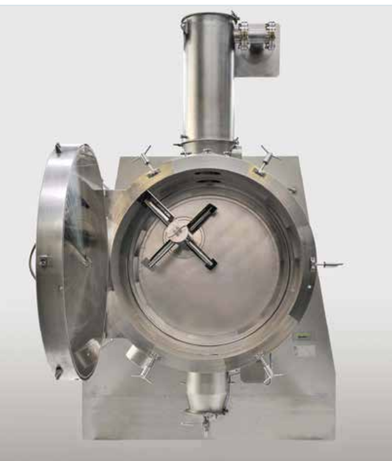
Сушильная система PLANEX с открытой дверью

Фирма Italcuim, одна из наиболее известных итальянских фирм – производителей вакуумных сушилок и насосов для химической и фармацевтической промышленности, занимающаяся разработкой оригинальных и инновационных продуктов с 1939 года, представляет новую горизонтальную лопастную вакуумную сушилку PLANEX®