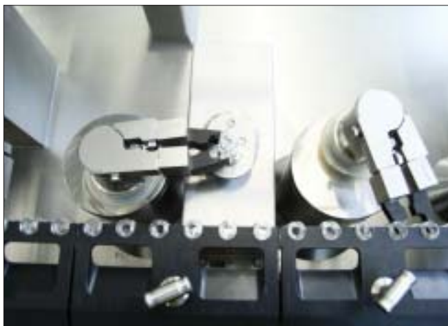
Станция проверки groninger: контроль в процессе изготовления

Компания «ЛЭНС-Фарм», являющаяся дочерним предприятием компании ОАО «ВЕРОФАРМ», производственные мощности которой расположены рядом с пос. Вольгинский в 100 км от Москвы, широко известна благодаря своим противоопухолевым препаратам и лекарственным средствам вспомогательной терапии, в которых сочетаются высокое качество и приемлемые цены