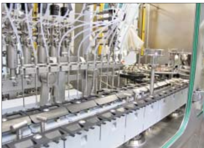
groninger UFVK 6005, станция розлива