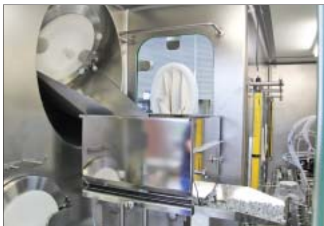
groninger UFVK 6005, подача стерильных пробок через RTP-порт (фотография сделана во время FAT-испытания на заводе groninger)

Линия включает мойку флаконов, стерилизацию и депирогенизацию, розлив, укупорку, закатку и внешнюю мойку. Розлив токсичного продукта производится с помощью роторно-поршневых насосов на машине groninger UFVK, где флаконы также укупориваются с помощью пробок для лиофилизата или альтернативно пробок для инъекций. Каждая линия включает две лиофильные сушилки. Сразу после закатки флаконы очищают снаружи, чтобы смыть любые токсичные вещества, которые могли остаться на поверхности