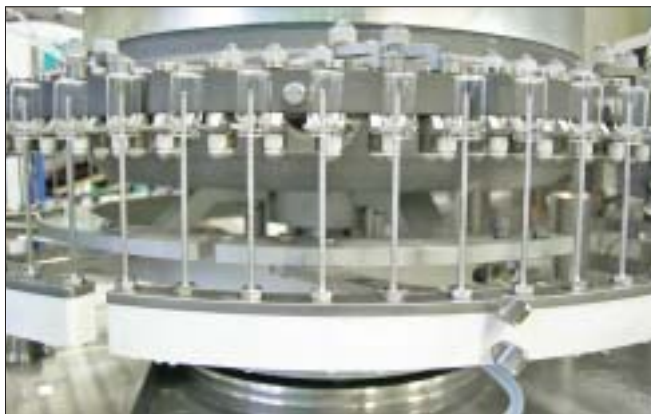
Моечная машина groninger