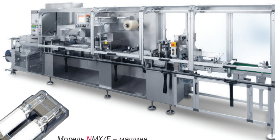
Модель NMX/F – машина для упаковки ампул и флаконов

Системы сваривания, формовки и вырубки, подачи продукции на загрузку имеют простую конструкцию, что делает смену форматных частей легкой даже для неквалифицированных операторов. ■