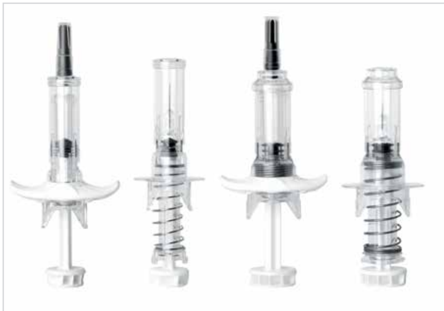
Компания Nemera разработала платформу пассивных устройств безопасности Safe'n'Sound для предварительно наполненных шприцев, защищающих от случайного укола иглой

устройства и его использованием. Изучение таких рисков требует полного понимания устройства, среды, в которой оно применяется, и его пользователей. Чтобы определить возможности для усовершенствования, следует провести анализ продаваемых устройств и неудовлетворенных потребностей с участием пользователей в целях выявления рисков и проблем, оценки удобства использования, а также моделированных клинических исследований для проверки гипотезы и ее подтверждения.