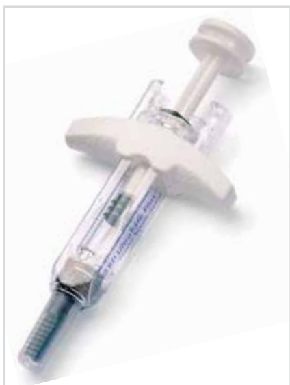
BD UltraSafe Plus™ Passive Needle Guard

BD UltraSafe Plus™ Passive Needle Guard – это отличный пример разработки продукта, адаптированного к новым требованиям рынка. В связи с тем, что пациенты все чаще отдают предпочтение самостоятельному инъекционному введению лекарственных средств, существует потребность в эргономичных и простых в использовании устройствах. В дополнение к инновационной технологии безопасности, предусматривающей автоматическую активацию, которая исключает риск какого-либо повреждения иглой во время ее извлечения, результатом ориентиро-