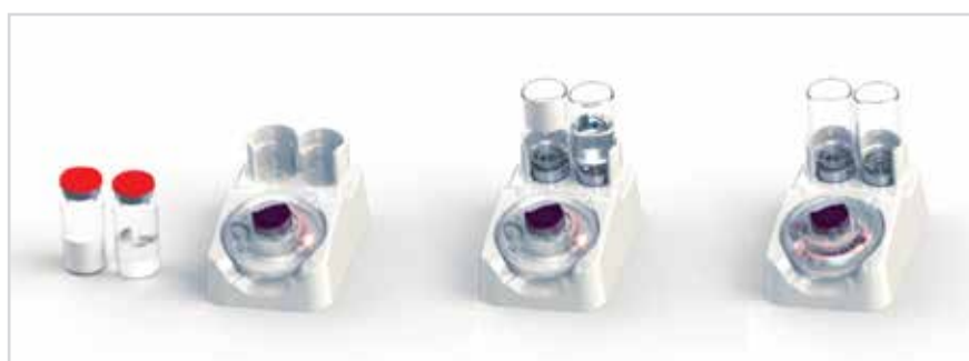
Enable Reconstitution System – полностью автоматизированная система для смешивания и переноса, которая позволяет смешать содержимое (жидкость с жидкостью или жидкость с порошком) двух флаконов объемом до 10 мл каждый

Упаковка BioPack компании Gerresheimer производится из сахарного тростника и является возобновляемой альтернативой традиционным PE и PET. Ее используют для упаковки как жидких, так и твердых лекарственных препаратов и косметических средств. BioPack обладает теми же характеристиками,