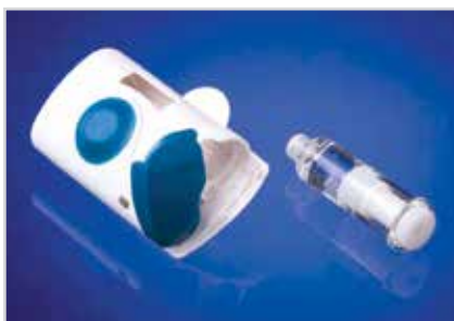
Пригодный для ношения электронный инжектор SmartDose ® производства компании West

Каждый элемент этих моделей систем доставки лекарственных средств – полимеры Daiky Crystal Zenith ® , электронный портативный инжектор SmartDose ® , подключаемые специальные медицинские устройства, разработанные совместно с HealthPrize, – являются инструментами нового поколения. Они помогают фармацевтическим компаниям создавать самые современные системы, которые не только приносят пользу пациентам, помогая им соблюдать схему лечения, но и обеспечивают всю полноту использования потенциала препарата, поставляемого на рынок. Системы доставки лекарственных средств также позволяют собрать массив данных для проведения анализа особенностей