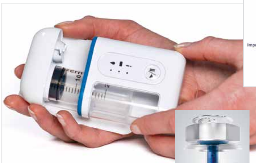
Компания Sensile является связующим звеном между препаратом и пациентом