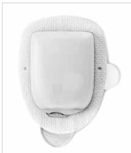
Система OmniPod для управления доставкой, разработанная компанией Insulet Delivery Systems Group

Например, систему OmniPod используют для введения препарата при стимуляции овуляции у женщин, когда необходимо делать инъекции каждые 90 мин в течение определенного периода лечения. Кроме того, врачу может потребоваться изменение дозировки препарата во время лечения. «До создания системы OmniPod пациент