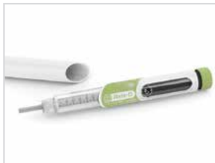
Одноразовая шприц-ручка Axis D™ компании Haselmeier с более широким круглым дисплеем и цифрами для установки дозировки

«Использование уникальных форм и материалов вносит свой вклад в создание устройств, более удобных для пациентов и обеспечивающих эффективную доставку